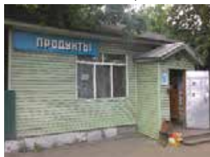
Здание магазина, нежилое